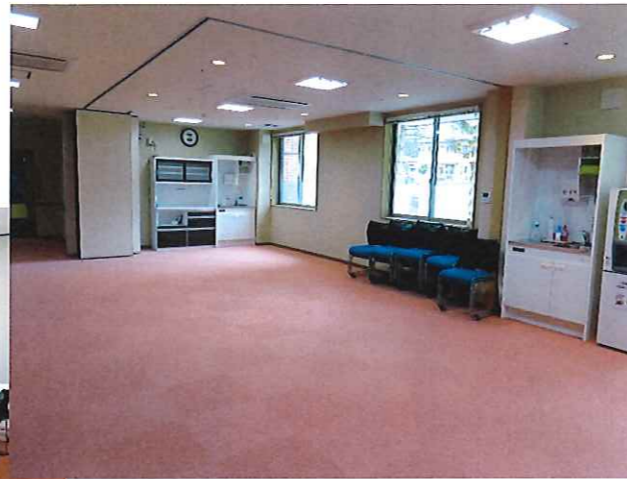
■ 地域交流スペース