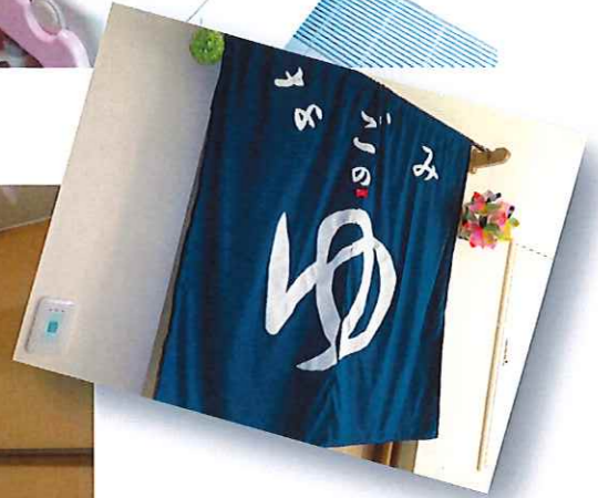
■ ユニット浴室 天然温泉 (源泉かけ流し)