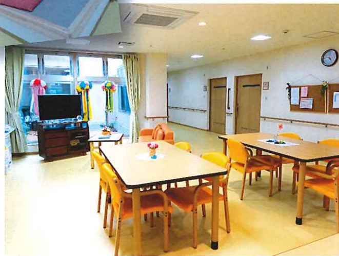
■ ユニット共同生活室